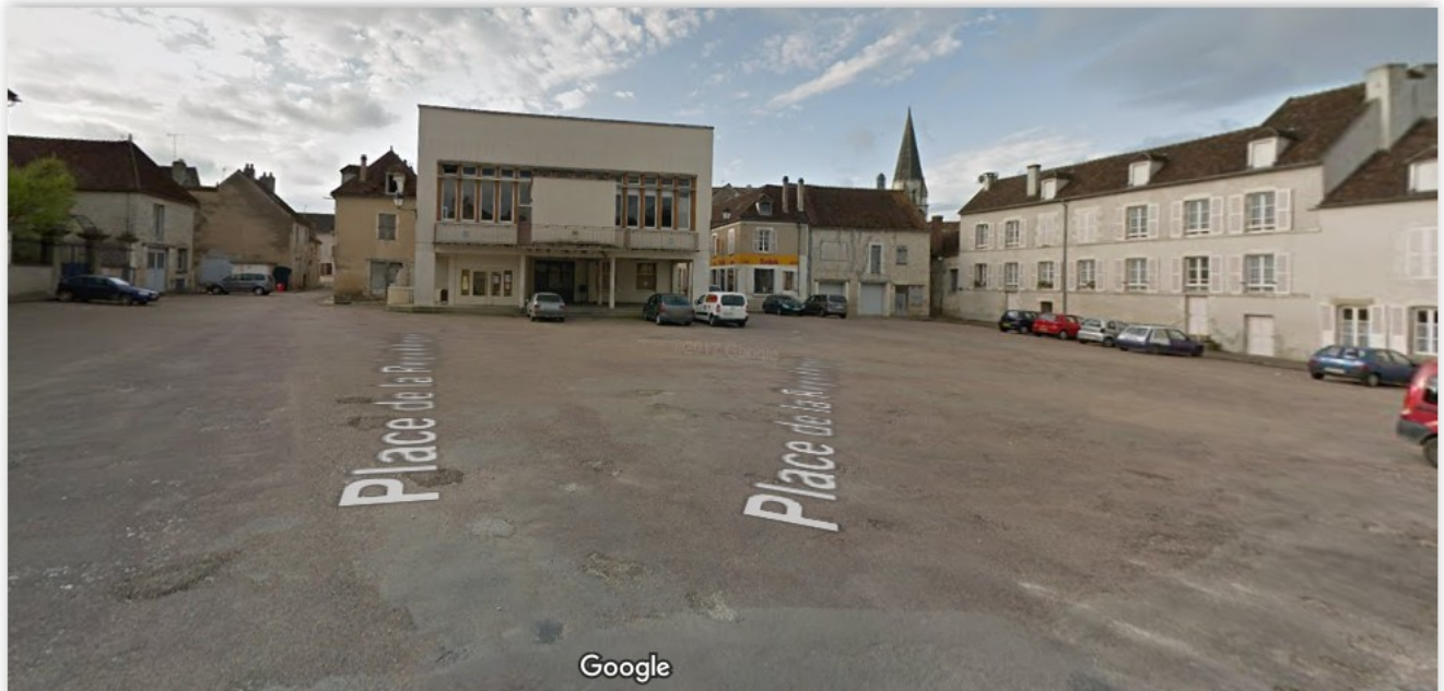
La place de la république avec la salle des Fêtes (salle du marché en dessous)